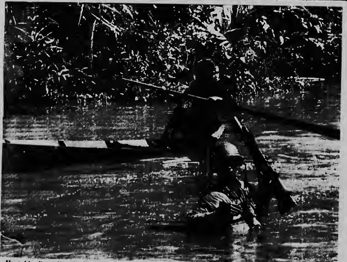
Un solda di un division Vietnam, activo den e operacion pa caba qu elementonan Viet Cong den e area di Mekong Delta, ta tene su arma di lanza granada haltu. Su tras un mucha muher ta rema tranquilamente di dje mientras qu rond di dje e accion di guerra ta sigui